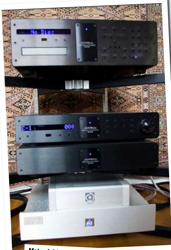
Mats elektronikstapel. Det är Krells Evolution-serie med CD 505 överst, försteg 202 med separat nätdel under samt Nordosts nätdistributör Thor och strömrenare Quantum QX4. Hyllan är en Finite Elemente Spider Rack. Bakom skymtar diverse kabelgodis från Nordost.

– Att elektronik och kablage blev Krell och Nordost beror på att det är välrenommerade tillverkare som har ett gott andrahandsvärde på en global marknad. Skulle jag få för mig att byta finns det alltid intresserade köpare någonstans på