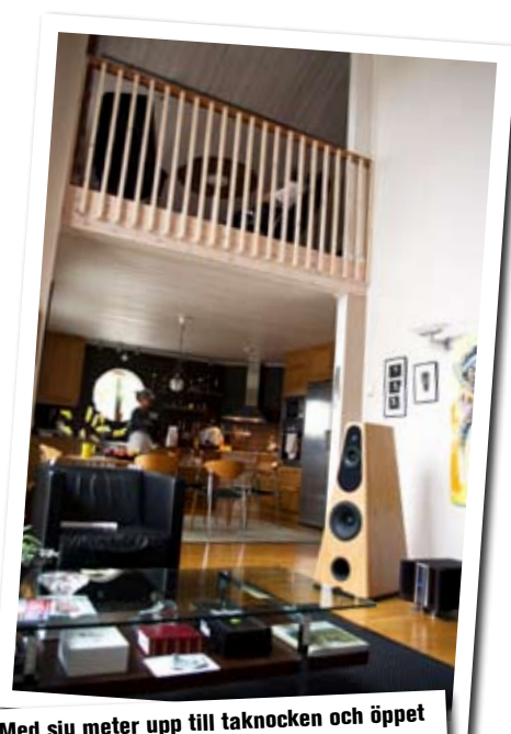
Med sju meter upp till taknocken och öppet ut till kök och TV-rum på andra våningen blir det få tidiga reflexer och basresonanserna blir beskedliga och väl utspridda.