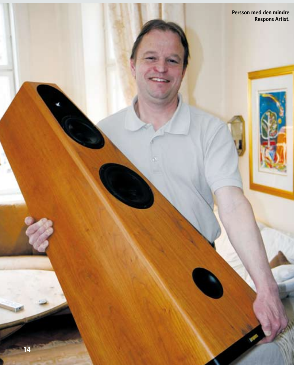
Persson med den mindre Respons Artist.

Dette gjelder ikke minst i den kilne overgangen mellom mellomtone og diskant der all verdens lydingeniører